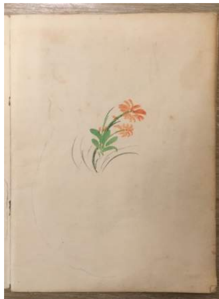
Foto 1 en 2: Voorkant en schutblad van "Indrukken uit Spijkenisse"

Het schriftje bestaat uit 14 bladen die bij elkaar gebonden zijn. Op 24 bladzijden zijn 12 "reclames" afgebeeld: op de linker bladzijde een tekening, op de rechterzijde een gedicht waarin de dienst of het product wordt aangeprezen. Het is onbekend wie de tekeningen en gedichtjes gemaakt heeft. De stijl van de tekeningen en de verdere inhoud hoort bij de jaren vijftig.