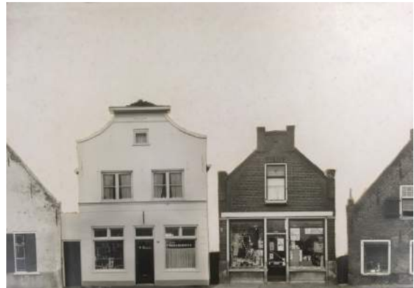
Foto 4 Voorstraat 14A, het witte pand links van het midden. Behalve het rechtse pand, dat de ingang aan het Groen Slop had, bestaan deze panden nu nog (nummers van rechts naar links: 14, 14 A en 16).

Tot 28-10-1942 was Voorstraat 14A het woonhuis van de Joodse slager Samuel Levie, daarna gymzaal en kleuterschool.